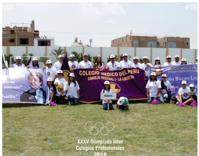
XXXV Olimpiada Inter Colegios Profesionales 2018

Las disciplinas que se llevaron a cabo fueron: fútbol, billas, sapos, tejos, ajedrez, natación, tenis de mesa, ciclismo de ruta, basquetbol, voley, etc.